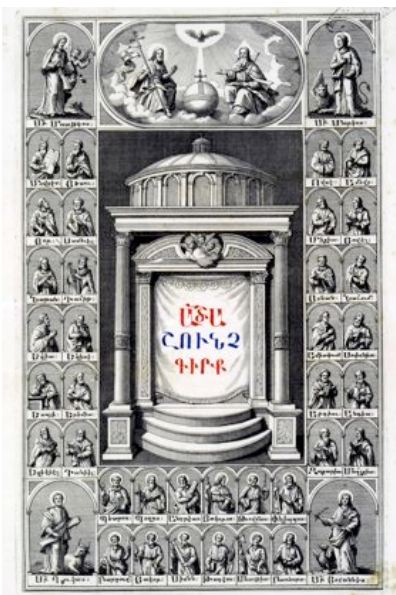
Bibbia di Mechtar (Venezia, 1733-35), antiporta BUB, coll.: A.M.O.V.1

Saranno visibili anche il facsimile della famosa "Mappa armena" e i due esemplari bolognesi della celebre Bibbia di Mechtar, impressa a Venezia tra il 1733 e il 1735.