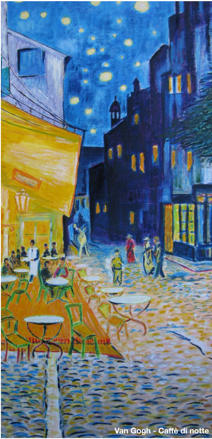
Van Gogh - Caffè di notte