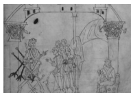
Bodleian Library, Ms Junius 11, p. 57