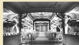
Teatro del Settecento di Villa Mazzacorati - Aldrovandi via Toscana, 19

in collaborazione con il Centro Sociale Ricreativo Culturale "Villa Mazzacorati"