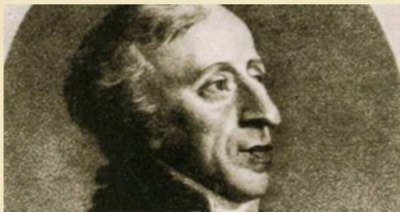
Vincenzo Righini è sepolto nel Cimitero Storico Monumentale di Bologna nella Loggia a Levante - Arco 10.

Nei primi del 1789 si recò a Magonza come kappelmeister dell'arcivescovo F. K. J. von Erthal rimanendovi fino al 1793. A Magonza scrisse numerose composizioni religiose la più nota delle quali è la Missa Solemnis op. 59. Nel 1793 si recò a Berlino sempre in qualità di maestro di cappella. Dopo la rivoluzione francese svolse una intensa attività in numerose regioni d'Europa. Morì a Bologna nel 1812 in occasione di un suo ritorno che nelle sue intenzioni doveva essere solo temporaneo.