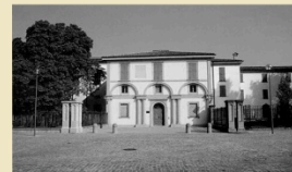
Museo del Risorgimento - Casa Carducci piazza Giosuè Carducci, 5

in collaborazione con il Museo civico del Risorgimento