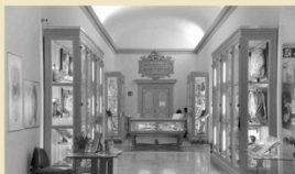
Museo delle cere Anatomiche "Luigi Cattaneo" via Irnerio, 48

in collaborazione con il Museo delle Cere Anatomiche "Luigi Cattaneo" e con il Sistema Museale di Ateneo