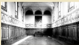
Sala Vasari Istituto Ortopedico Rizzoli via G.C.Pupilli, 1