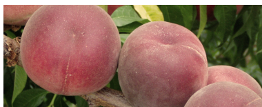
Pesche luglio e agosto.