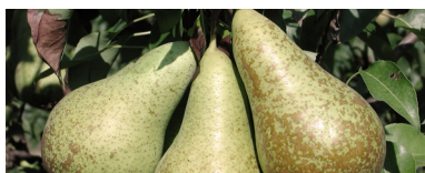
Pere luglio, agosto e settembre.