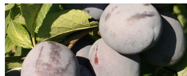
Susine luglio e agosto.