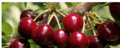
Ciliegie maggio e giugno.