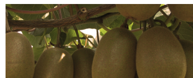
Kiwi settembre e ottobre.